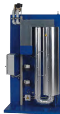
Perslucht catalysator voor olie- en bacterievrije perslucht