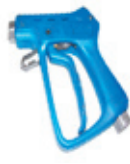
2. Optioneel ST3100