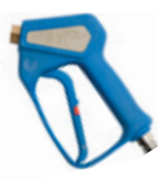
1. Optioneel LETS310